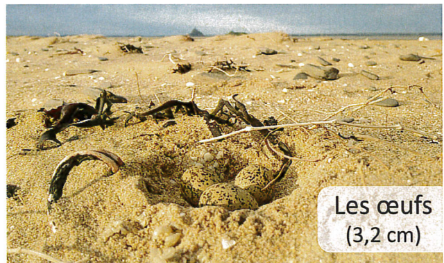
Les oeufs (3,2 cm)