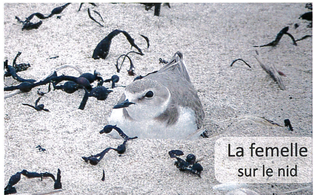
La femelle sur le nid