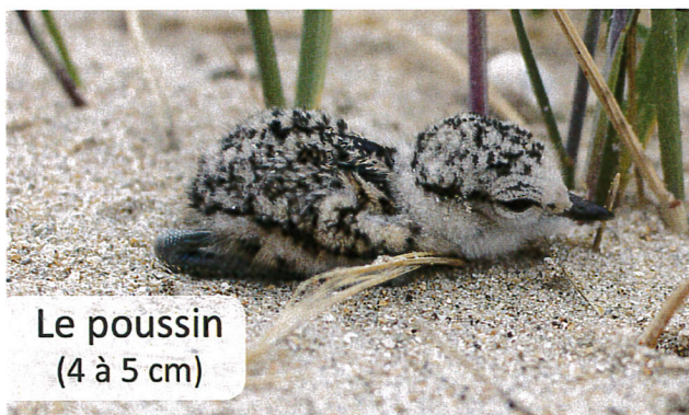
Le poussin (4 à 5 cm)