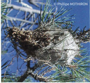
Nid sur branche