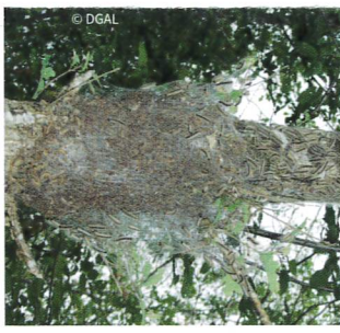
Nid sur branche